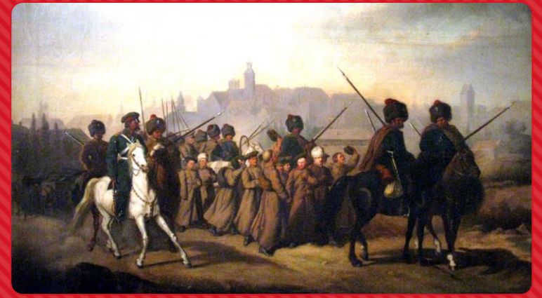
○ POWSTANIE STYCZNIOWE