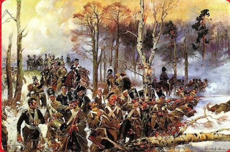
○ POWSTANIE KOŚCIUSZKOWSKIE