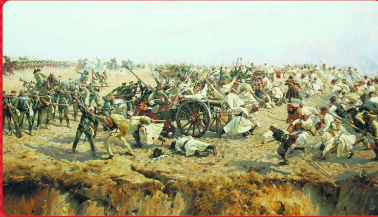
○ POWSTANIE LISTOPADOWE