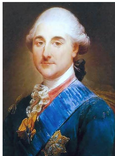
Stanisław August Poniatowski